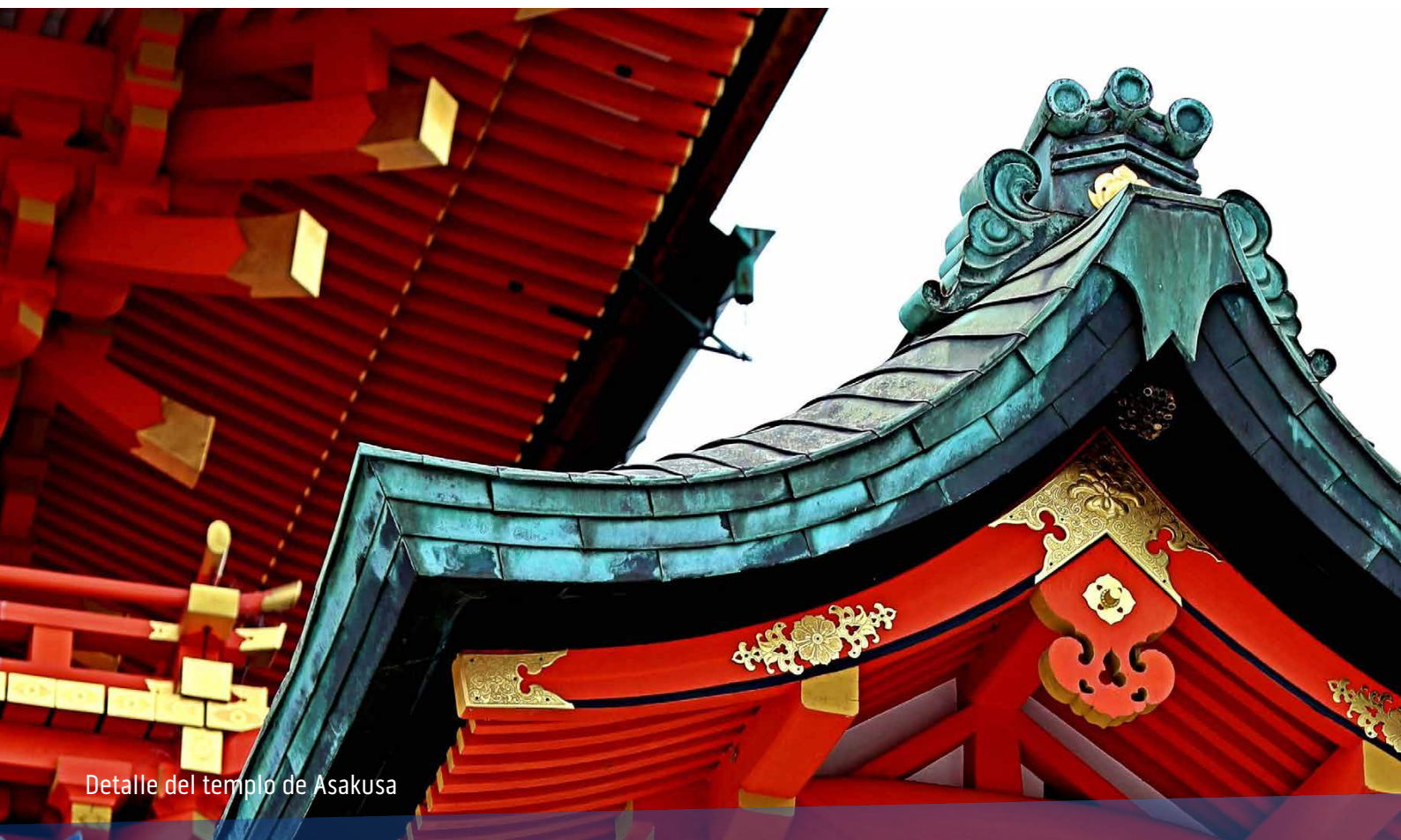
Detalle del templo de Asakusa