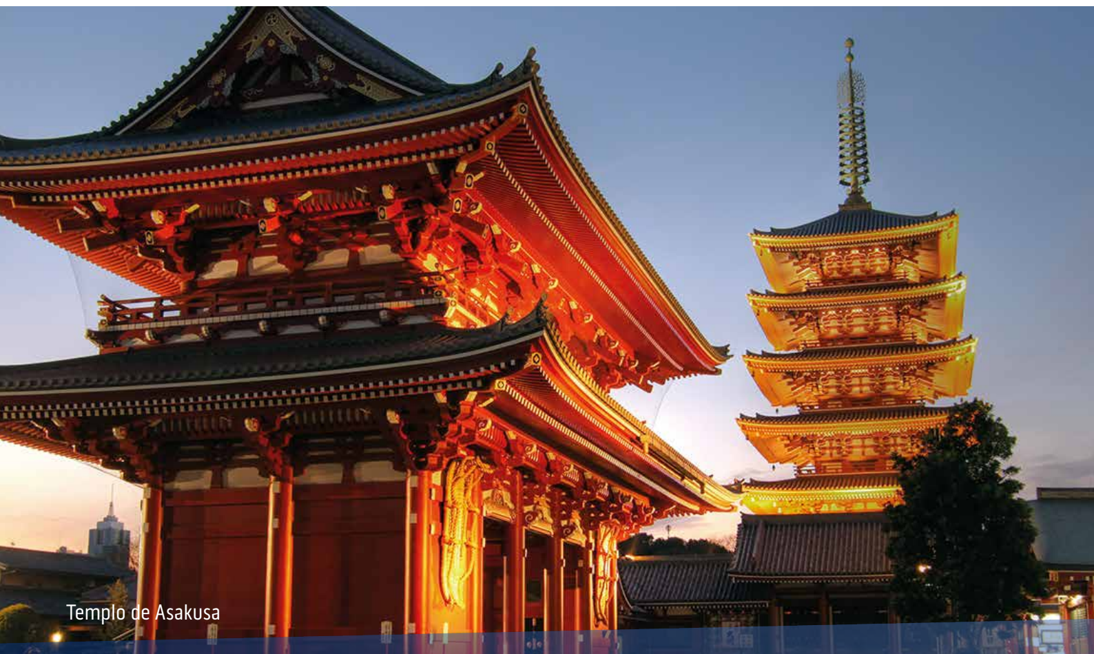
Templo de Asakusa