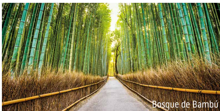
Bosque de Bambú