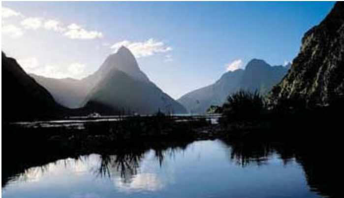
Parque Nacional Fiordland — Nueva Zelanda

Sea testigo de las vistas increíbles y las atracciones únicas de Australia y Nueva Zelanda. Explore ciudades limpias y modernas como Sydney y Auckland, conozca los koalas y los canguros, navegue por el pintoresco Parque Nacional Fiordland y visite la exótica Tasmania. En una navegación de 13 días en los días festivos, usted visitará el nuevo puerto de la Isla Phillip en donde puede disfrutar de la inolvidable experiencia del desfile de los pingüinos.