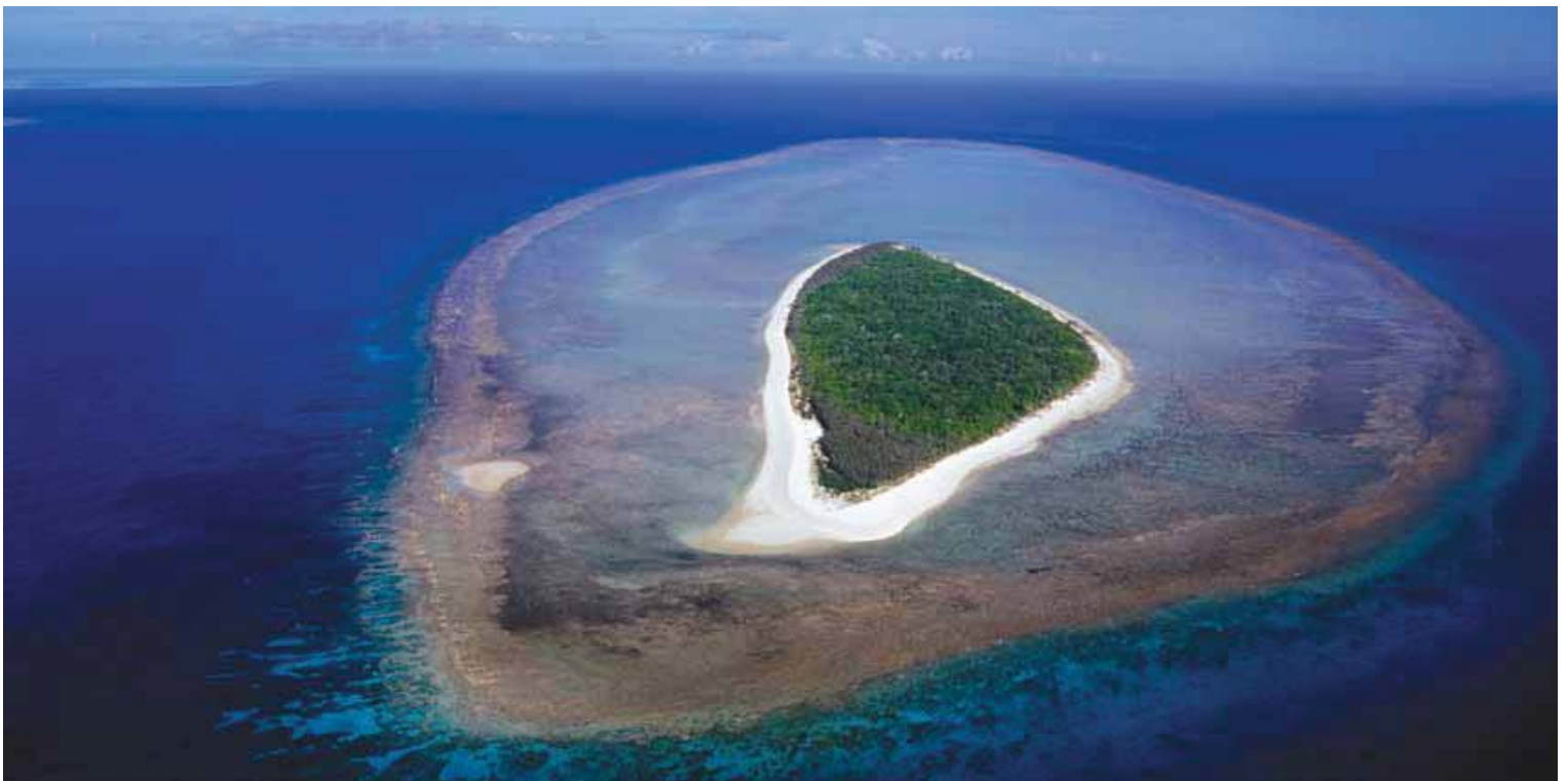
Isla con vegetación coralina, Australia