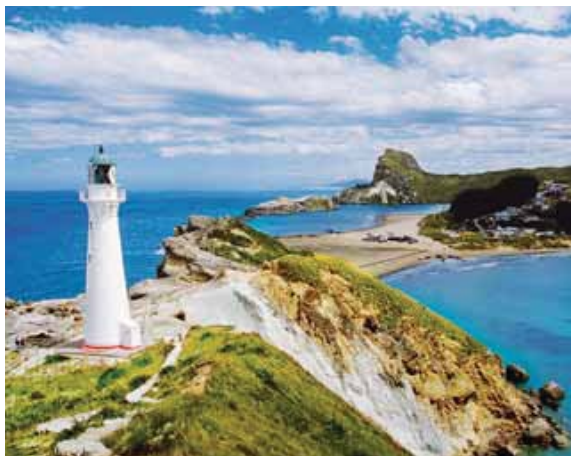
Napier, Nueva Zelanda

Usted puede tomar una excursión en tierra opcional de 3 días y 2 noches a Angkor Wat desde Sihanoukville y volver al barco en la Ciudad de Ho Chi Minh. También puede pasar los Días 11-14 en una excursión en tierra de 4 días y 3 noches al Parque Nacional Kakadu desde Darwin y volver al Barco en Port Douglas. Para más información, visite princess.com.