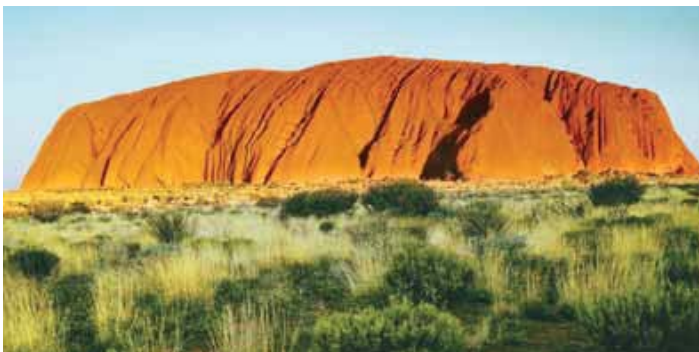
Roca Ayers — Australia