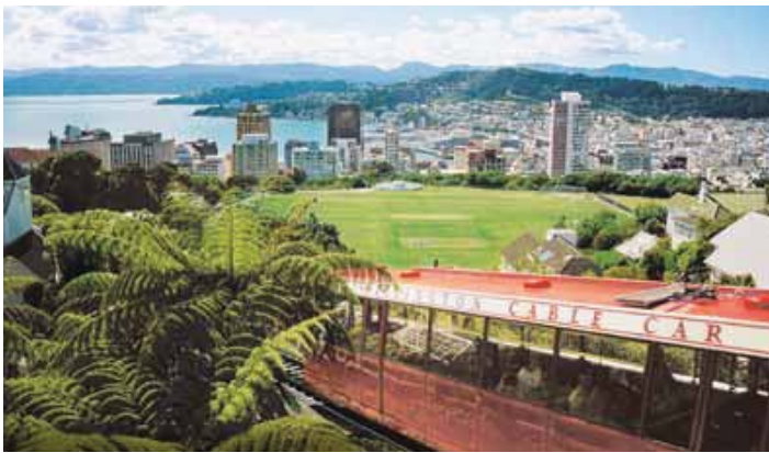
Wellington, Nueva Zelanda

* Los cruceros en el Sun Princess® y en el Dawn Princess® con base en Australia usan los dólares australianos como moneda de a bordo. No se dispone de Comidas de Turnos Abiertos®. Otras opciones de comidas y entretenimiento varían.