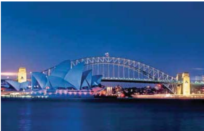
El Teatro de la Opera — Sydney, Australia