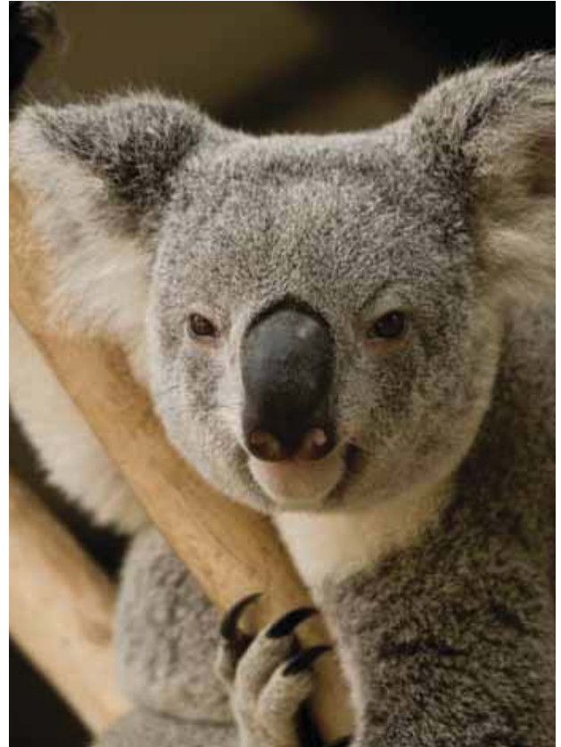
Koala en Arbol de Eucalipto, Australia