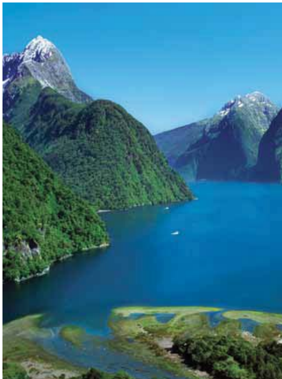
Parque Nacional Fiordland — Nueva Zelanda

† El itinerario opera en el orden inverso. Los horarios de los puertos pueden variar.