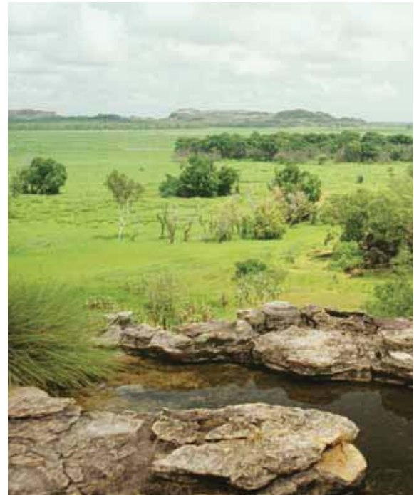
Parque Nacional Kakadú, Australia